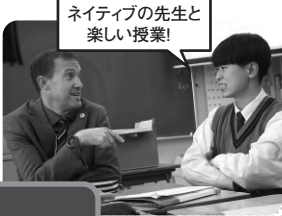
ネイティブの先生と 楽しい授業!

1カ年留学を含む3年間で 高校卒業が可能! ※留学中の本校授業料は 発生しません。