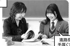
進路指導が 手厚くて安心!