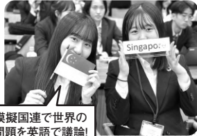
模擬国連で世界の 問題を英語で議論!