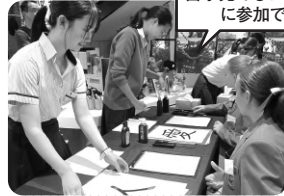
留学先でもボランティア に参加できる!