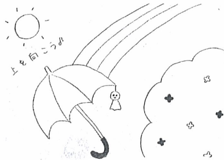
Afternoon Tea (岡山市東区 中2)

だから私は、お世話になった先輩に感謝しながら、今後の部活に取り組みたい。先輩方はとても強かったから、私も先輩みたいになれるよう努力していきたいと思った。試合に出て少しでもいい結果が出せるように、今までいただいたアドバイスをもとにがんばっていききたい。