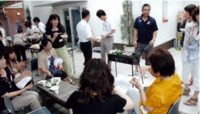
講演後は、バーベキューで和気あいあい