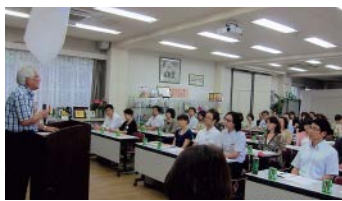
▲学園長の話に真剣に聞き入る