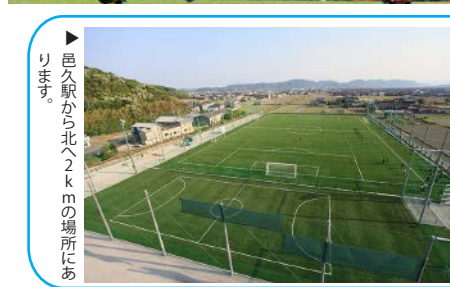
▶邑久駅から北2kmの場所にあります。

人工芝サッカー場がオープンしました！ ますます充実の学芸館高校サッカー部の活躍にご期待下さい。