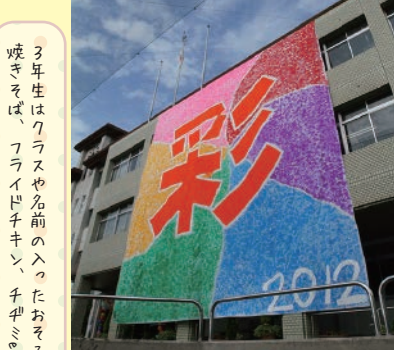
▲ 全校生徒による庄巻の手形