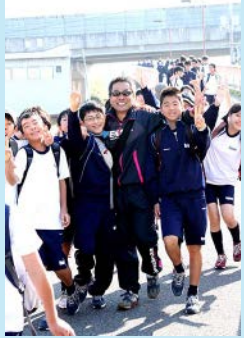
▲清秀中学生も校長先生と元気一杯完歩！