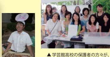
▲ 学芸館高校の保護者の方が、手作りの甘くて美味しいワッフルを販売!