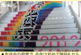
▲ 生徒会の発案で、今年初めて階段もカラフルに装飾しました。