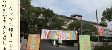
▲ 生徒会のメンバーが夏休み返上で学校を装飾。