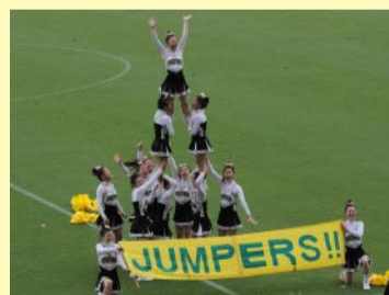
▲雨の中を元気いっぱいに演技!

当日は台風が岡山を直撃することが確実と思われていたが、奇跡的に試合時間中は時折小雨がぱらつく程度で、ぼつちり観戦できました。また、本校吹奏楽部、和太鼓部がオープニングを飾り、ハーフタイム