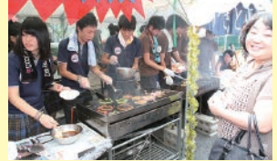
▲ 「アンパンマンのあんぱんですよ〜」