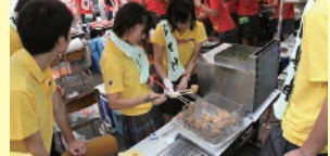
▲ 「たこ焼き買いに来てね〜!!」