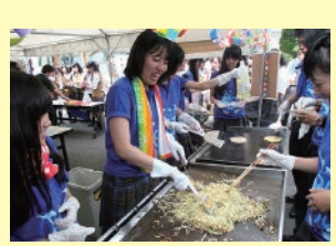
▲ 投票の結果、模擬店1位は3年E組でした!