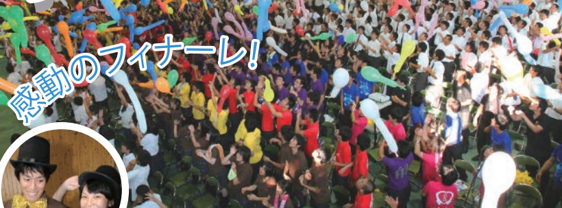
▲ 全校生徒による校歌斉唱の後、実行委員長の合図の元、色とりどりのジェット風船が体育館の天井を舞い、大きな歓声があがりました。

秋晴れの中、9月13日に合唱コンクール・14日に文化祭を行いました。3年生は最後の学芸祭。クラスが1、2年生は工夫を凝らした展示。どのクラスも協力して取り組みました。今年の学芸祭は生徒会と文化委員が中心に企画、運営しました。