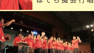
▲ 合唱コンクール栄光の総優勝は、3年B組でした!

秋晴れの中、9月13日に合唱コンクール・14日に文化祭を行いました。3年生は最後の学芸祭。クラスが1、2年生は工夫を凝らした展示。どのクラスも協力して取り組みました。今年の学芸祭は生徒会と文化委員が中心に企画、運営しました。