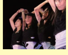
▲ 3年生は最後のステージでした。