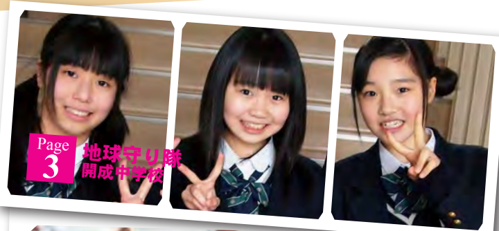
Page 3 地球守り隊 開成中学校