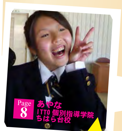
Page 8 あやな ITTO 個別指導学院 ちはら台校