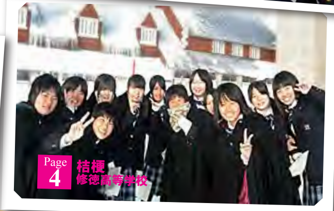
Page 4 桔梗 修徳高等学校