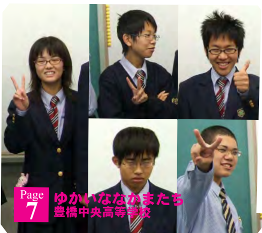
Page 7 ゆかいななかたち 豊橋中央高等学校