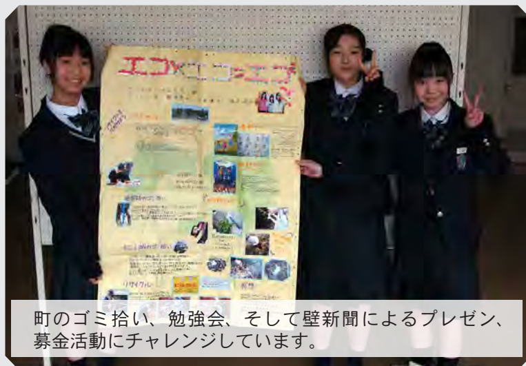
町のゴミ拾い、勉強会、そして壁新聞によるプレゼン、募金活動にチャレンジしています。