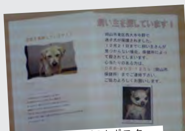
里親と迷子犬を探すポスター。殺処分されるところだった犬 2 頭を救出できました。

私たちには人の命を救うことは難しいけど、動物の命を救うことはできるのではないかと思い、動物ボランティアをしています。