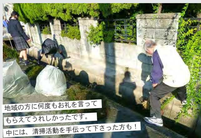
地域の方に何度もお礼を言ってもらえてうれしかったです。中には、清掃活動を手伝って下さった方も！

私たちが登下校に利用している地域を、みんながより気持ちよく過ごせるようにしたいと本気で思ったので、毎朝 1 時間、地域の清掃を行っています。