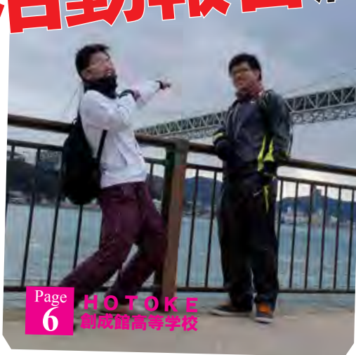
Page 6 HOTOKE 別成館高等学校