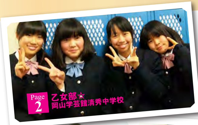
Page 2 乙女部★ 岡山学芸館清秀中学校