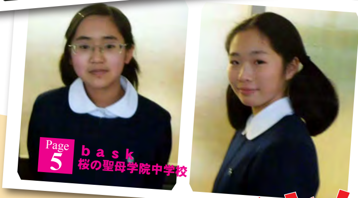
Page 5 bask 桜の聖母学院中学校