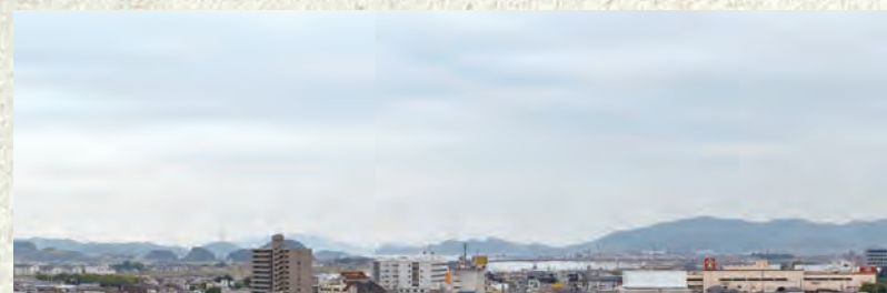
清秀中学校・高等部の校舎はキャンパスの南端にあり、眺望も良好。眼下には吉井川の下流域が広がる(写真上)。1階エントランスには、いろんな掲示物が。「東大新聞」や卒業生の活躍、何やら料理の写真がいっぱい貼られた立て看板まで(写真右)。実はこれ、コロナ禍での自粛期間に、生徒たちが親と一緒に作った「我が家の味」なんだとか。毎日作ってくれる家族の気持ちがよくわかりましたと感想をもらす生徒も多かったそう