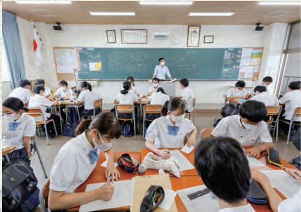
習熟度別のハーフクラスで行われる高1「古典」。この日は、係り結びの表現などに気をつけながら、紀貫之の「土佐日記」を読み通す

かなりアップテンポの授業が展開されていたのは、タロック先生が担当する中1「英語」(写真左)。先生のノリに合わせて、生徒たちはゲーム感覚で次々に問題にチャレンジ。そのスピード感あふれる様子には正直驚かされた。同校では、どの教科でも生徒が主体的・能動的に取り組む様子がよく見られる。それは、日々の授業はもちろん、「タイ・カンボジア研修」を始めとする多彩な海外研修プログラムなどでも発揮されている。五感に訴えかける感動体験のプログラムの数々は、まさに同校の真骨頂だろう。