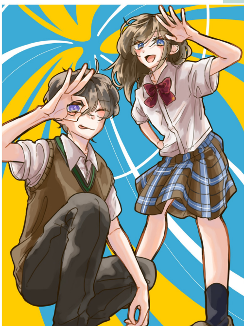
イラスト:スーパーVコース1年 安井真光路 (岡山学芸館清秀中学校)

9/14 (土) 9:30 ~ 14:30 (模擬店 10:00 ~ 14:00)