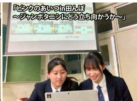
「シシクのおいでin田んぼ 〜ジャンボタニシにどう立ち向かうか〜」