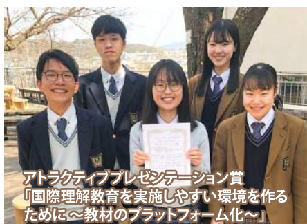
アトラクティブプレゼンテーション賞 「国際理解教育を実施しやすい環境を作るために〜教材のプラットフォーム化〜」