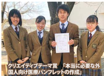
クリエイティブテーマ賞 「本当に必要な外国人向け医療パンフレットの作成」