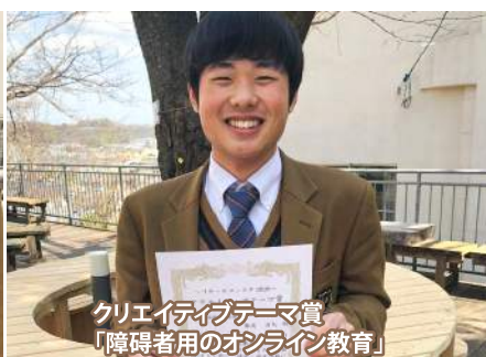
クリエイティブテーマ賞 「障害者用のオンライン教育」