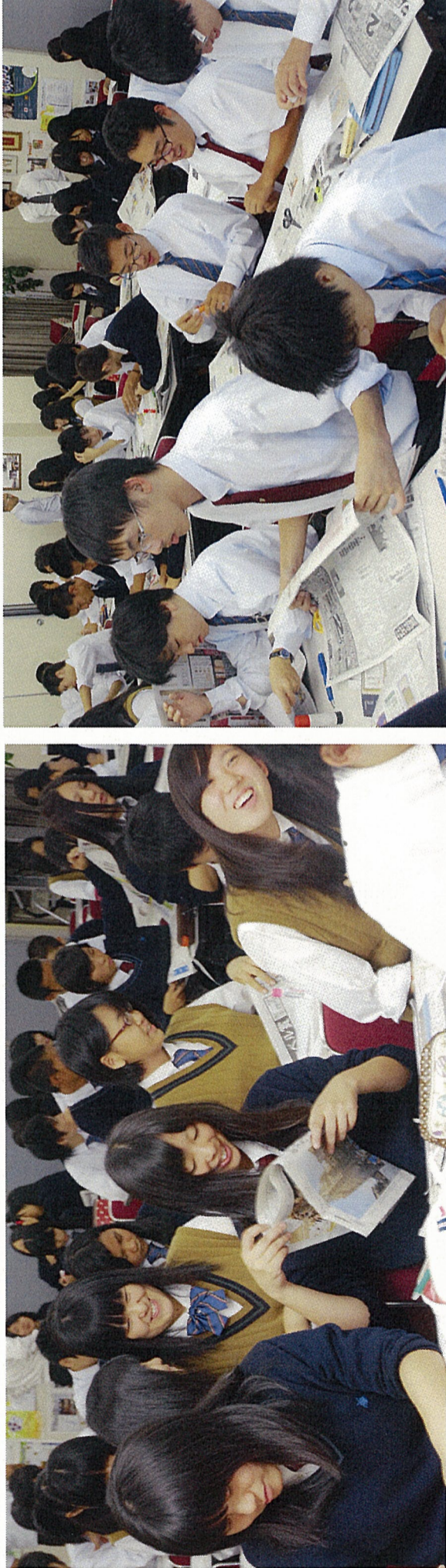
ニュースペーパー イン エデュケーション